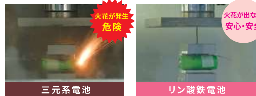
発火実験 (2種の電池に釘を刺し発火する可能性を実験)